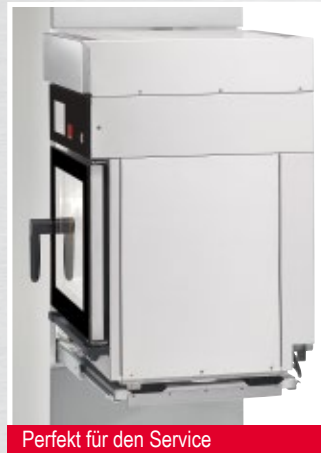
Perfekt für den Service