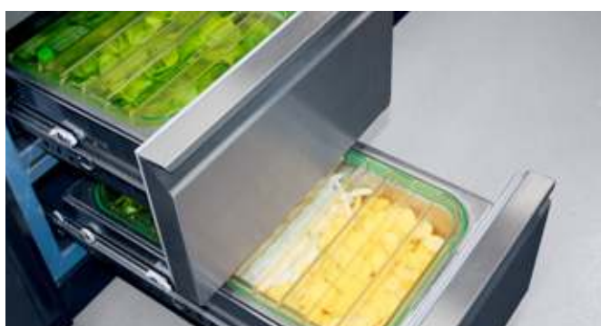
Das smart cooking Prinzip