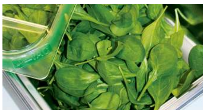
Vakuumieren ohne Grenzen