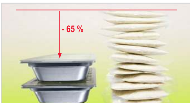
65 % weniger Verpackung